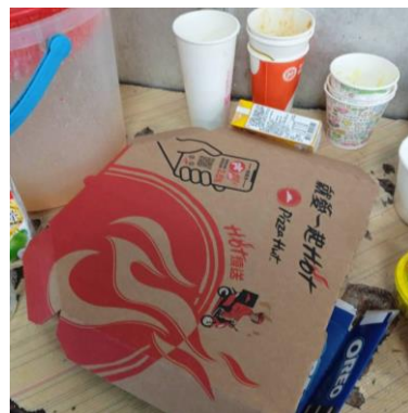
1140311 下午 1608 時段拍攝