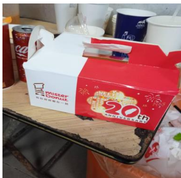
1140310 下午 1720 時段拍攝