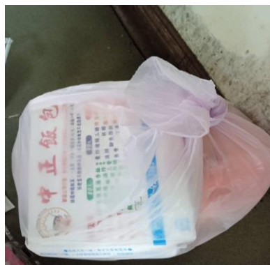
1140310 上午 1005 時段拍攝