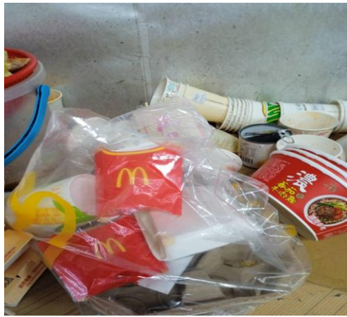
1140313 上午 1003 時段拍攝