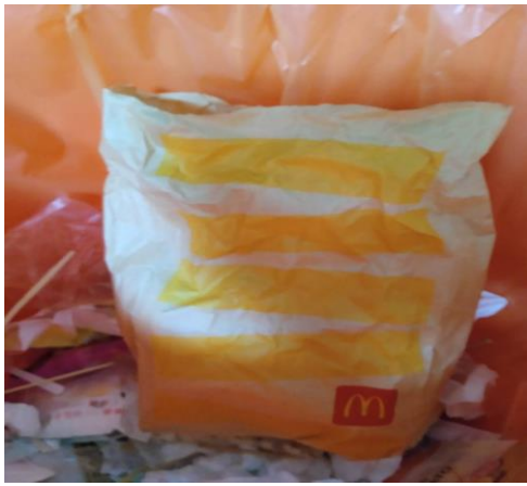
1140312 上午 0957 拍攝