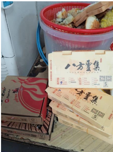
1140313 上午 1003 時段拍攝