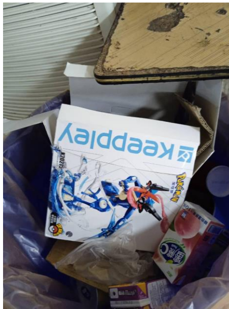
1140313 下午 1640 時段拍攝