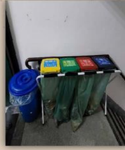
德肋撒樓一樓 樓梯間