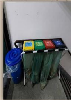
德肋撒樓一樓 樓梯間