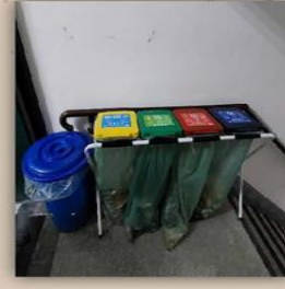
德肋撒樓一樓 樓梯間