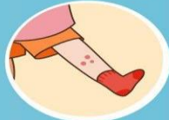
手腳膝蓋水泡 或紅疹