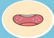
口腔小水泡 或潰瘍